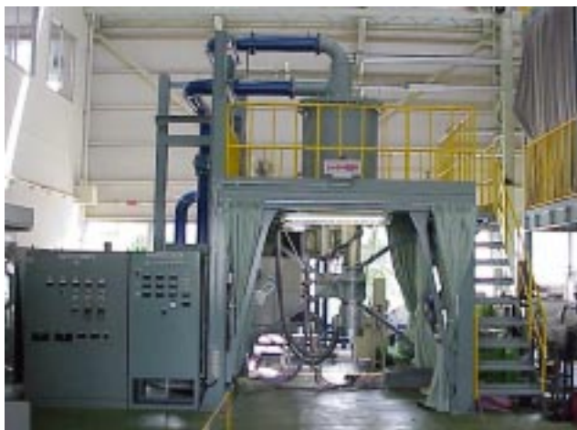
図 1 ABWR 向け 1/5 縮尺炉内流動試験設備

現在、主に、実験では捉えることのできない熱流動現象の解明に利用するとともに、気水分離システムや界面を有する機器内部の二相流に適用して、高性能化、高信頼化のための構造検討に活用している。並列計算機を用いた大規模計算が可能となってきており、さらに複雑な体系の詳細解析に活用していく予定である。